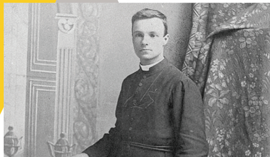
"Quand vous dites Notre Père... Il a l'oreille collée à votre bouche" (Saint frère André)

Par milliers, les fidèles venaient y rencontrer le frère André pour lui demander de prier à leurs intentions. De nombreux miracles ont ainsi été attribués à son intercession. Aujourd'hui, l'Oratoire Saint-Joseph accueille plus de 2 millions de visiteurs chaque année.