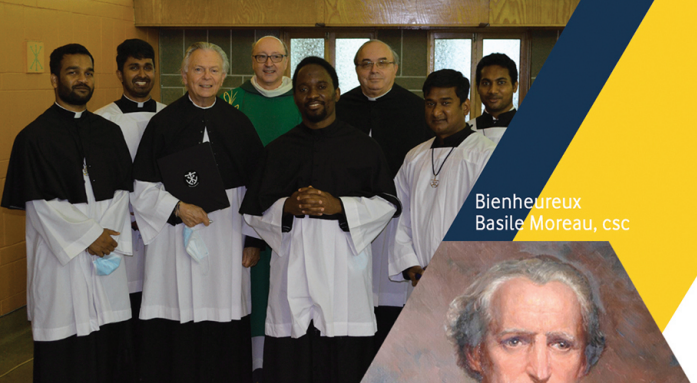
Bienheureux Basile Moreau, csc