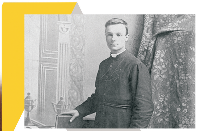
"Dieu ne demande pas l'impossible" (Saint André Bessette)